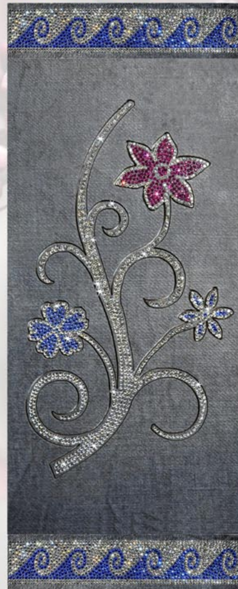
Ramo Fiorito Onde Blu