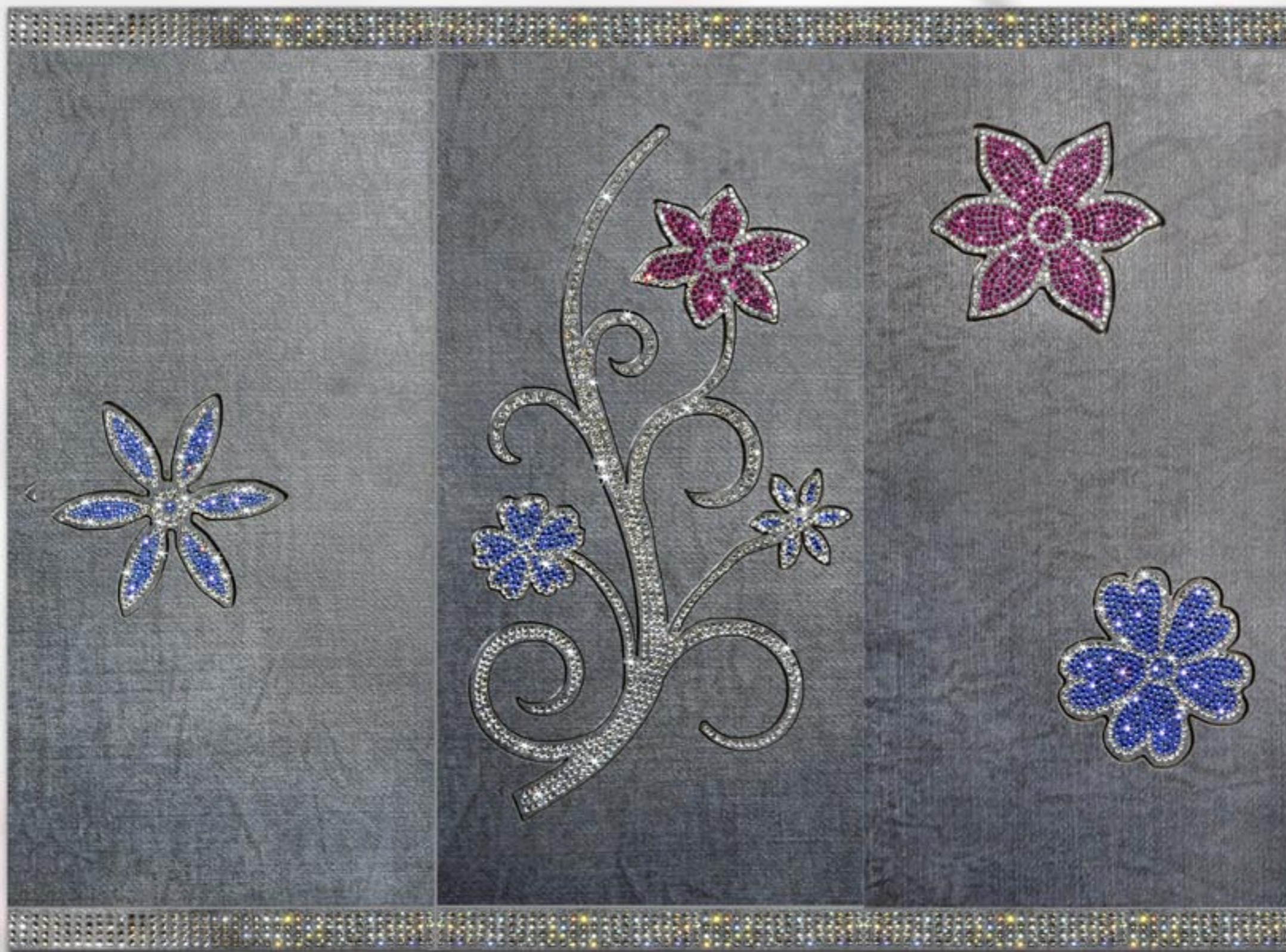
Pann.: Aria di Primavera List.: Luci Bianche