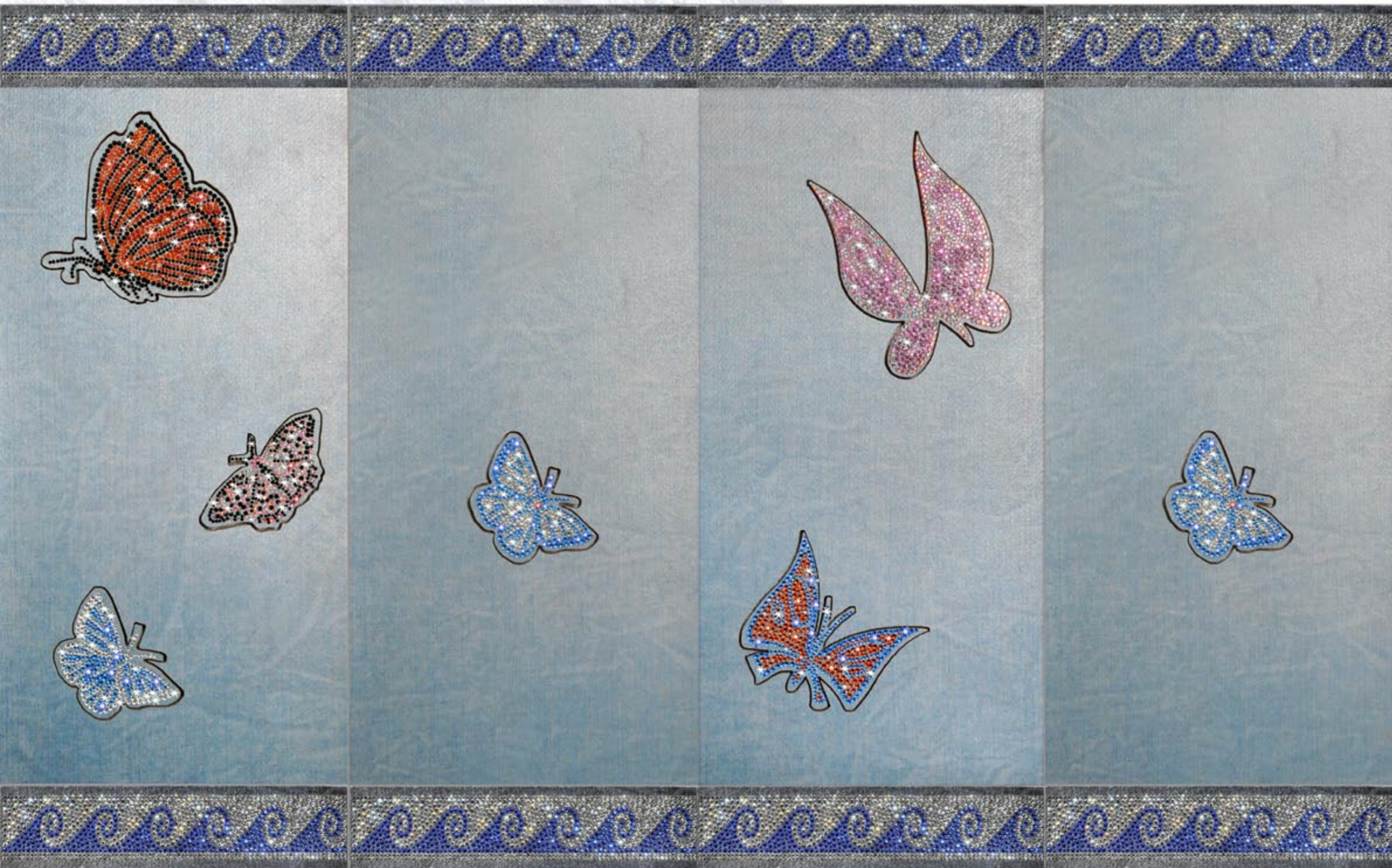
Pann.: Danse de Papillons - listello: Onde Blu