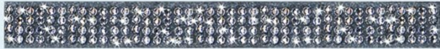
Luci Bianche listello 2x21 cm 0,8"x8,3"